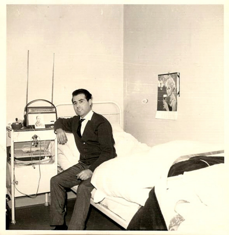
Fotografía enviada por un emigrante español al Correo de La Pirenaica Alemania 16/01/1963.

la visita de Víctor del Val, profesor ya jubilado. Una lectora del libro era amiga suya. Evidentemente para nosotros fue un orgullo entregarle copia de la carta remitida por el sacerdote-padre adoptivo y de la respuesta que tuvo del Partido. El asesinato de Julián Grimau y las oleadas de protesta y rechazo que este crimen supuso entre los antifranquistas; o la solidaridad de los oyentes de la Pirenaica con los presos antifranquistas, especialmente con los encarcelados en el Penal de Burgos, que disponían de sus propias emisiones «Antena de Burgos», la emigración económica «la diáspora» como los autores la denominan, las huelgas del 62 en Asturias; el hambre sufrida, las riadas; la emigración a los suburbios de las ciudades, la falta de agua; las chabolas; las igualas de médicas; el