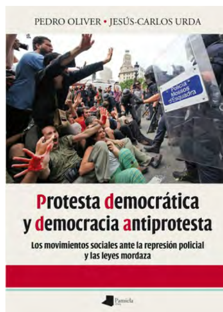
Jesús Carlos Urda, Protesta democrática y democracia anti-protesta , Pamiela, 2015)