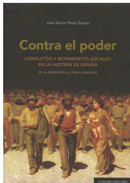
Sisinio Pérez Garzón, Contra el poder. Conflictos y movimientos sociales en la Historia de España , Comares, 2015.

Las vicisitudes por la que atravesó en el caso español una cultura de la protesta centrada en el repertorio cosmopolita son analizadas en detalle por Cruz. En un primer momento la intolerancia que caracterizó a los gobiernos de la Restauración impidió que arraigara esta cultura. Sería ya durante los años treinta cuando, a pesar de las restricciones a la pre-