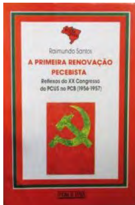
Raimundo: Santos A primeira renovação pecebista: reflexos do XX Congresso do PCUS no PCB . Oficina de Livros, 1988.

«Con una trayectoria marcada por la constante persecución y prohibición, el partido buscó desarrollar una rápida ocupación de espacios en el movimiento sindical que le sirviese de instrumento para contrarrestar su posición de partido proscrito, acreditándolo como fuerza de peso en el interior del escenario político nacional. El PCB tratará de articular los dos aspec-