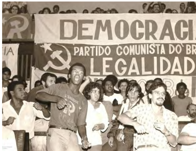
Acto por la legalización del Partido Comunista de Brasil, 1985.

En un país con tan escasa cultura política centrada en los partidos políticos, el ejemplo del Partido Comunista de Brasil llama mucho la atención. Fue, sin duda alguna, la mayor agremiación en el campo de las izquierdas y tal vez el mayor entre todos los campos políticos e ideológicos. El partido llegaría a tener 100.000 militantes en 1946, una infinidad de organizaciones sindicales, asociaciones comunitarias y movimientos sociales. La fuerza con que influyó en la vida pública del país solo se compararía con la entrada en escena del Partido de los Trabajadores (PT) en la década de 1980.