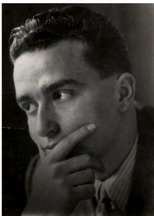
Retrato de Pietro Ingrao en 1943, ya militante del Partido Comunista Italiano

Se afilió al PCI en 1940, participando en la Resistencia y sobre todo en la dirección de la edición clandestina de l'Unità . Desde este punto de vista, seguir la trayectoria que llevó al joven intelectual a unirse al PCI asume un valor más general: en la estrategia de Palmiro Togliatti hay en efecto una preocupación sincera por la implicación en el partido de la generación de jóvenes intelectuales crecidos bajo el fascismo. Se trató de una amalgama de resultados inciertos, si bien retrospectivamente perfectamente alcanzados, entre generaciones diversas —la de la fundación del PCd'I y la llegada a la política en los años del Frente Popular y de la guerra—, entre experiencias y prácticas potencialmente conflictivas —las del exilio y las de la clandestinidad y la lucha armada—, entre diferentes orígenes sociales —intelectuales, obreros y campesinos. La misma amalgama por ejemplo que, tal vez, no alcanzó el grupo dirigente del PCE, en este caso sobre todo a causa de la mayor duración del régimen fascista en España; una mayor duración que favore-