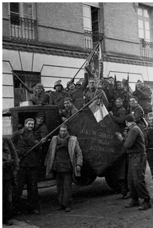
Voluntarios italianos del Batallón Garibaldi en la guerra civil española

El tercer seminario del día entró de lleno, como no podía ser de otra manera en el contexto actual, en la cuestión de cómo crear y mantener la solidaridad y la cooperación entre las fuerzas de izquierda en el contexto europeo actual. Aquí la reflexión histórica se utilizaba claramente para alimentar una reflexión prospectiva para el futuro constatando de entrada la diversidad de las herencias de las izquierdas radicales. El profesor Philippe Marlière del prestigioso University College London propuso una clasificación en cuatro bloques: una izquierda comunista identitaria del sur de la Europa que reivindica las raíces comunistas como los Partidos Comunistas Griego, Portugués o Francés. A eso se añadirían unas fuerzas roji-verdes de corte eco-socialistas, claramente anclados en la realidad de los países escandinavos pero también presentes cada vez más en otros países europeos. El tercer grupo lo