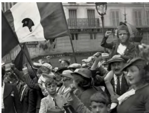
Celebración popular de la victoria del Frente Popular, París, 14 de julio de 1936

El 25 y 26 de Julio de 2015 tuvo lugar en París la conferencia internacional sobre la historia cruzada del comunismo en el siglo XX. Organizada por varias fundaciones (Transform! Europe e Instituto Gramsci de Roma) bajo la coordinación de la fundación Gabriel Péri, ésta congregó en París algunos de los mayores especialistas sobre la historia del comunismo y de la izquierda en Europa. El objetivo central era pensar colectivamente la actualidad de las variadas herencias de la historia de los comunismos en Europa usando una perspectiva