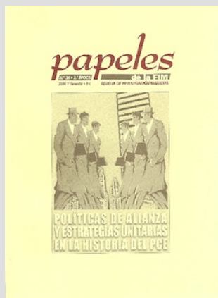
Políticas de alianza y estrategias unitarias en la historia del PCE. En: Papeles de la FIM, 24 (2006)