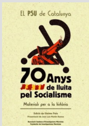
Pala, G (ed.). El PSU de Catalunya. 70 anys de lluita pel Socialisme , 2008