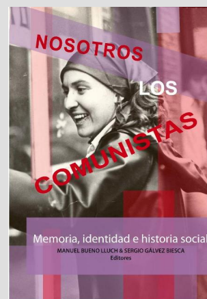
Bueno, M y Gálvez, S (eds) Nosotros los comunistas: Memoria, identidad e historia social , 2009.