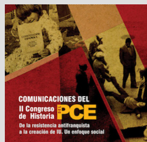
Comunicaciones del II Congreso de la Historia del PCE. De la resistencia antifranquista a la creación de IU,