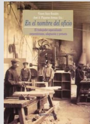
Piqueras, J.A., En el nombre del oficio , Biblioteca Nova, 2005.