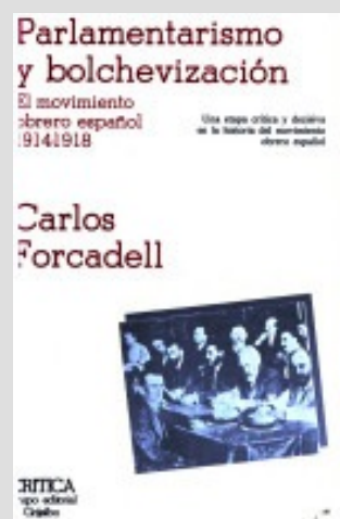
Forcadell, C. Parlamentarismo y bolchevización , Crítica, 1978