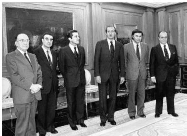
Representantes políticos junto a Juan Carlos I tras el fallido golpe de Estado del 23 de febrero de 1981. De izq. a dcha.: Santiago Carrillo, Landerino Lavilla, Adolfo Suárez, Juan Carlos I, Felipe González y Manuel Fraga.