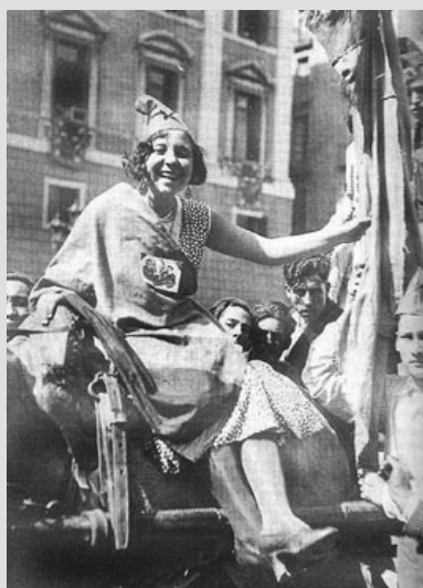
Simpatizante republicana con el gorro frigio durante la celebración por la proclamación de la República en las calles de Barcelona. 14 de abril de 1931.

la monarquía al lugar que realmente ha ocupado en las etapas más recientes de nuestro pasado, más allá de las campañas mediáticas desafortunadamente laudatorias como las que, nuevamente, nos vemos obligados a presenciar. Es el momento de replantear con ojos nuevos —porque la realidad de nuestros días lo reclama— lo que fue el proceso de la transición post-franquista, arrumbando con las visiones canónicas idealizadas sin por ello incurrir en el error de edificar nuevos mitos en sentido contrario. Es preciso reabrir el debate sobre la función precisa de la figura del monarca antes, en y después de los años cruciales del cambio político de entonces, en circunstancias y en episodios diversos, desmitificando la imagen propagandística del rey como piloto del cambio (frente a un pueblo al parecer inerte y esperando a su salvador) o garante último y casi único de la democracia (como en el aún controvertido episodio del 23-F). Necesitamos, por salud democrática, discutir en profundidad sobre el protagonismo de la sociedad civil, de los grupos políticos y de las fuerzas populares en ese proceso. En ese orden de cosas, nuestra Sección de Historia está ya preparando un amplio congreso dedicado al papel de los comunistas en la Transición, que, obviamente, abordará además cuestiones que van más allá del propio PCE y sus aledaños, y que tienen que ver con la interpretación del proceso en su conjunto.