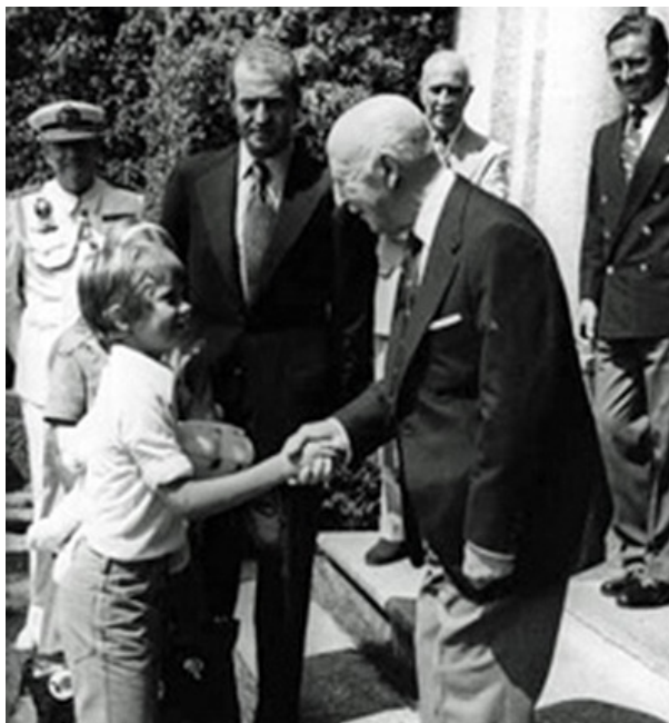
El dictador Francisco Franco saluda a Felipe de Borbón en presencia de su padre. Pazo de Meirás (A Coruña), agosto de 1975.

Pero, al margen de nuestra percepción como ciudadanos y de la pluralidad de opiniones que los integrantes del colectivo de historiadores de la FIM podamos albergar sobre el futuro político inmediato de nuestro país, el cambio de una a otra testa coronada es una buena ocasión para recordar nuestro papel en la reconstrucción de una narrativa histórica crítica y rigurosa que devuelva a