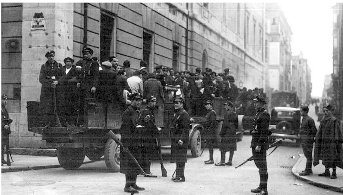
Conducción de presos en Gijón durante la Revolución de Asturias, 1934