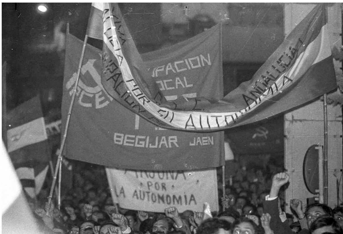
Participación de la agrupación comunista de Begíjar en la manifestación por la autonomía andaluza del 2 de diciembre de 1979 en Jaén.

res [18] . Fue probablemente la cárcel en la que el PCE estuvo más y mejor organizado durante la dictadura franquista, puesto que allí recalaban buena parte de sus líderes y militancia, circunstancia que permitió a Francisco continuar su formación y trabajo político en una situación de extrema dificultad demostrando que, pese a lo sufrido, aún quedaban energías para la lucha anti-franquista. Ello le permitió también establecer contactos con camaradas de otros puntos del país que se revelarán de gran utilidad años después para la reconstrucción del partido [19] . Como muestra de hasta qué punto llegaban las ansias represoras del franquismo, podemos señalar también el procedimiento abierto contra Francisco